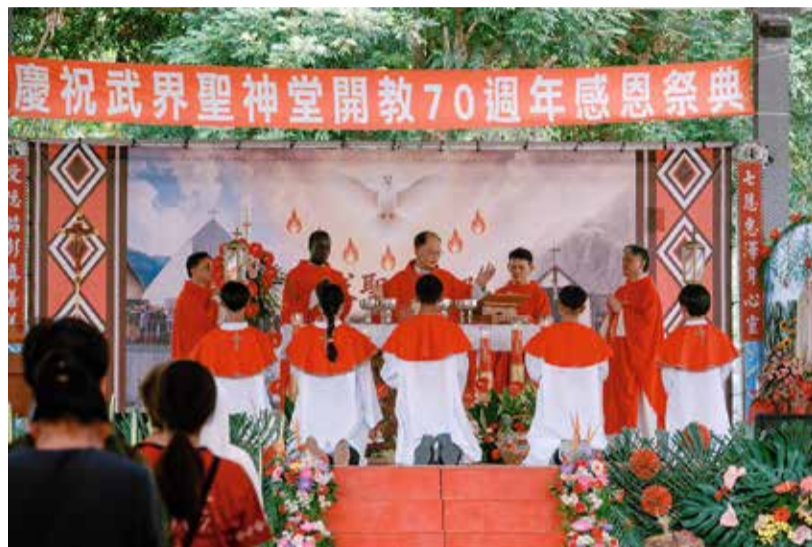
主教於聖神降臨節為武界聖神堂開教 70 週年主禮感恩祭典。

此外，教宗提醒，聖神並非只在五旬節降臨一次，而是持續在教會與聖事中工作：在聖洗中使人成為基督徒，在堅振中使人成