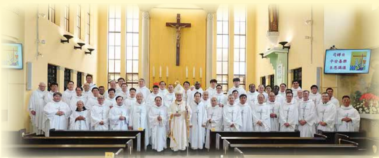
主教在天主堂與司鐸們歡慶司鐸日合影

1961年6月在美國晉鐸，9月旋即派遣到台灣服務，63年鐸職歲月致力於牧靈福傳及關